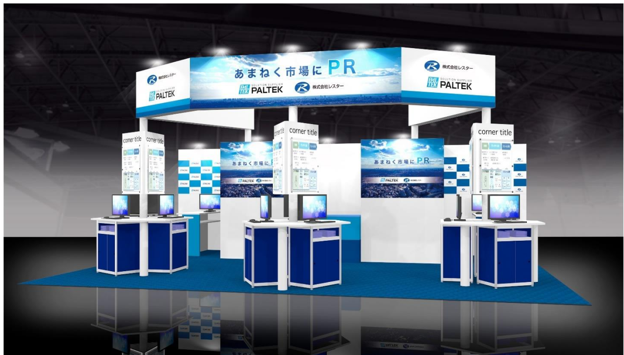
展示会ブースイメージ

本展示会では、「あまねく市場にPR」をテーマに、PALTEK(P)とレスター(R)が「自動化/省人化、人流解析、安全監視」に関して、両社の強みを活かした具体的なソリューションを展示します。カメラ、センサー、FPGAなどの商材を活用し、生産現場や人流解析などお客様の製品開発支援、技術サポートなど多くの経験をしているレスターグループの2社が、ニーズに応じた最適な製品やソリューションをご提案します。是非ブースにお立ち寄りください。